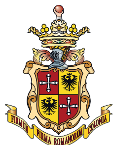
Comune di FERMO