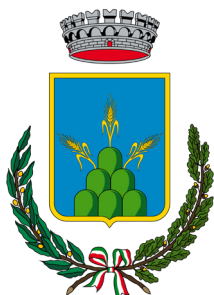
Comune di MONTEGRANARO